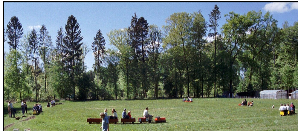
Erste Rundkurse auf unserem Gelände, 2002

Fahrbetrieb mit echten Dampf- und Elektroloks in 5 und 7 ¼ Zoll