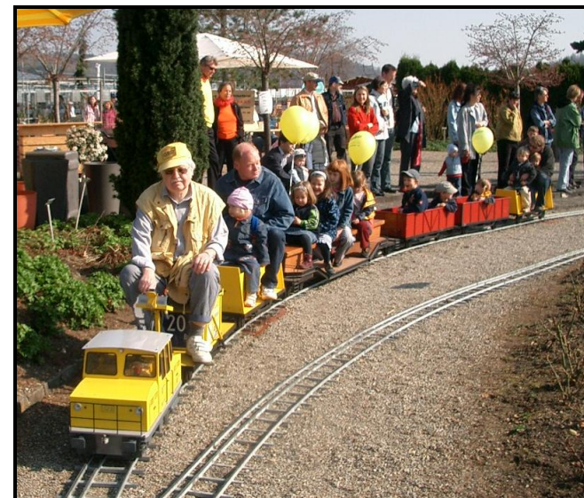
Auswärts-Fahrt mit unserem transportablen Geleise (Rafz, März 2005)

Fragen Sie in jedem Fall unseren „Kordinator Fahrtage“.